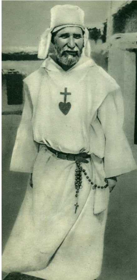
El P. Foucauld delante de su ermita