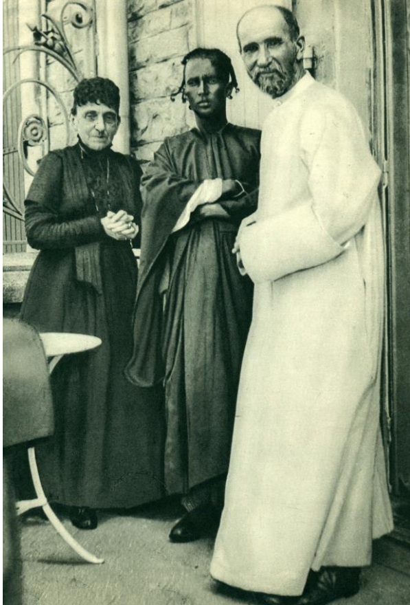
El P. Foucauld y Ouksem, joven targuí, en casa de la Sra. de Bondy (1913).

Tamanrasset – 11 de agosto de 1905 – 1916