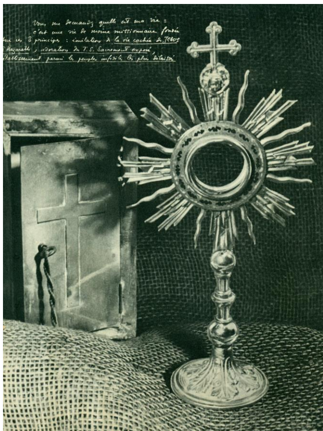
Sagrario y custodia de la ermita de Tamanrasset